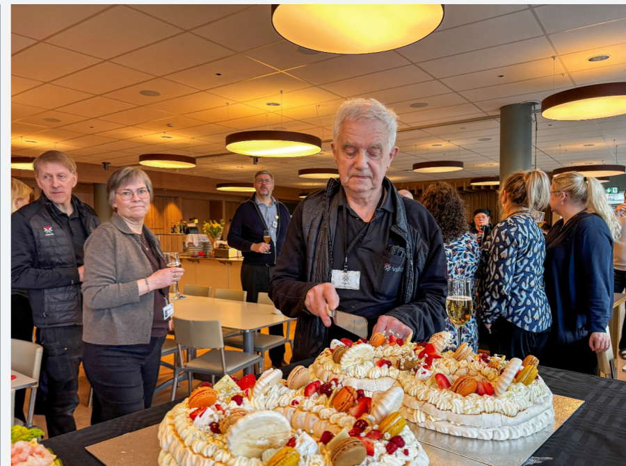
80 ára afmælisveisla í Verkís.

Árlega eru haldin þakkarhóf fyrir þau sem kjósa að hætta að vinna við sjötugt en einnig til að fagna þeim tímamótum þegar fólk fer á tímavinnusamning. Bæði núverandi og fyrrverandi starfsfólki er boðið