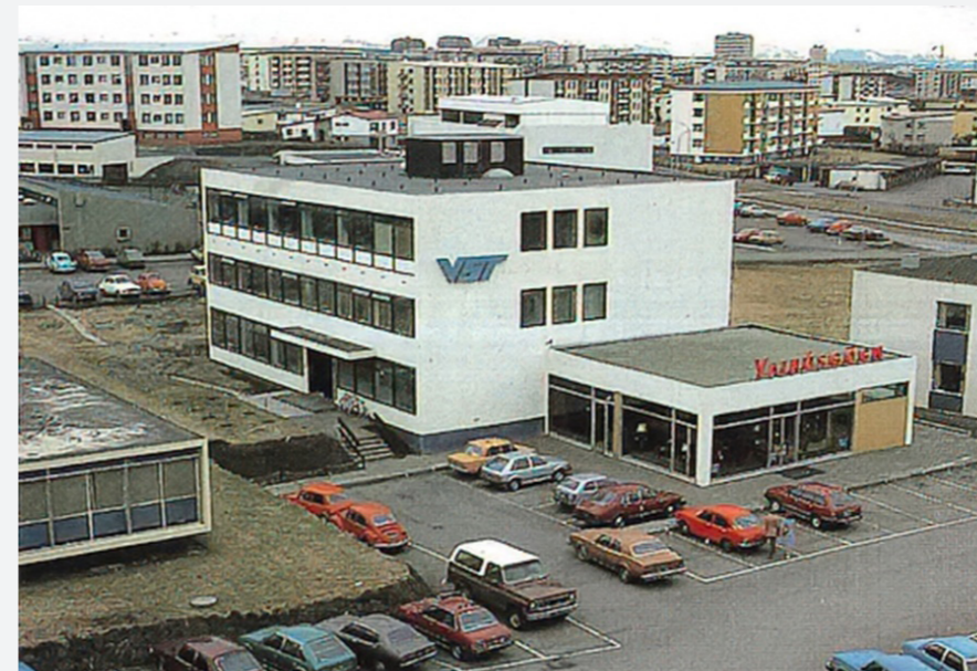
Má þótti skemmtilegast að byggja gamla húsnæði Verkís við Ármúla.

Ölfusborgir standa í dag. Þá var þarna ekkert nema mói. Við mældum miklu stærra svæði en það sem var byggt á í fyrsta áfanga, líklega um 25 til 30 hektara. Ári síðar fórum við aftur til að gera jarðkönnun og staðsetja húsin.“